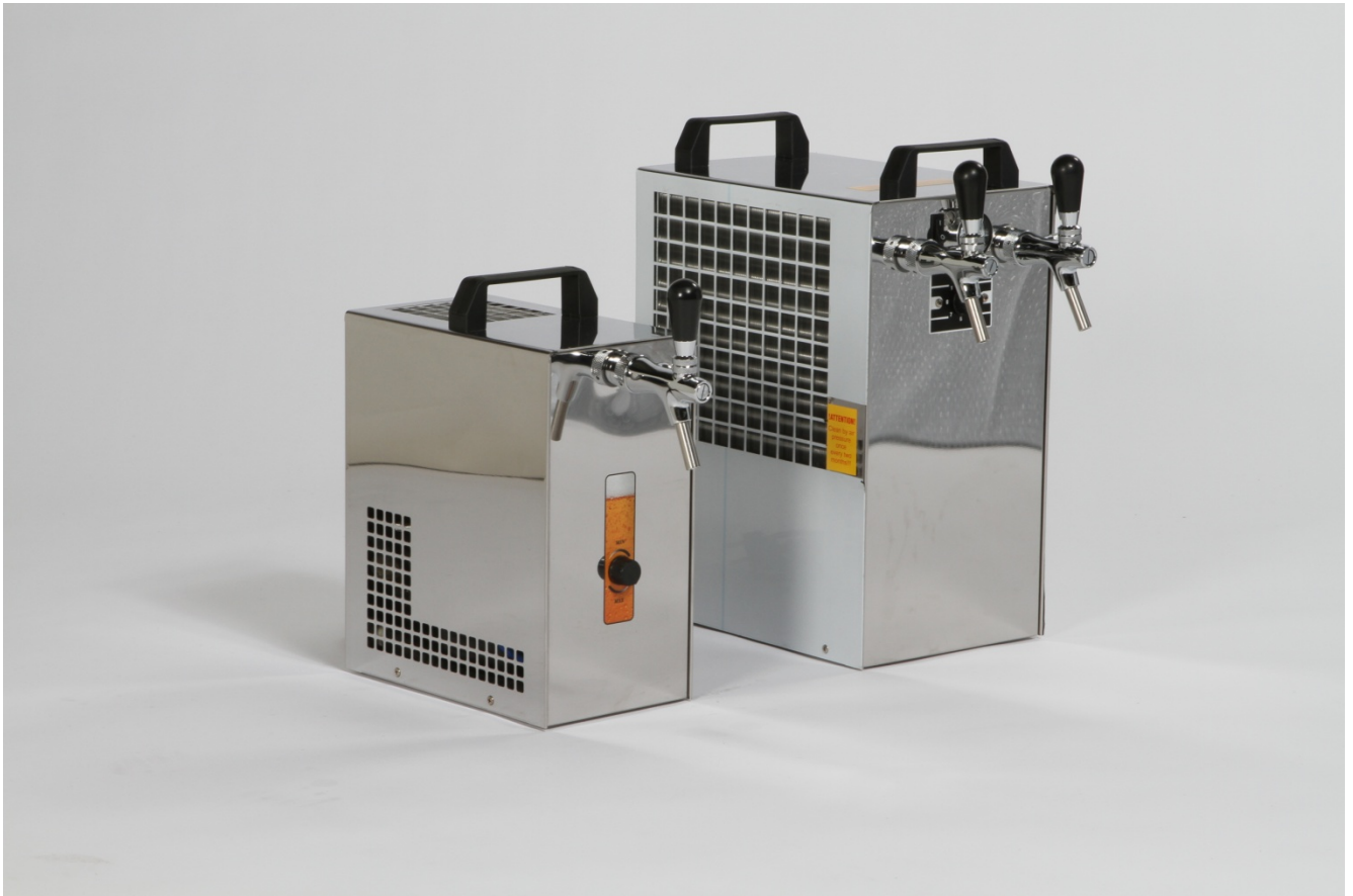
Фото: 1 DC30 и DC90