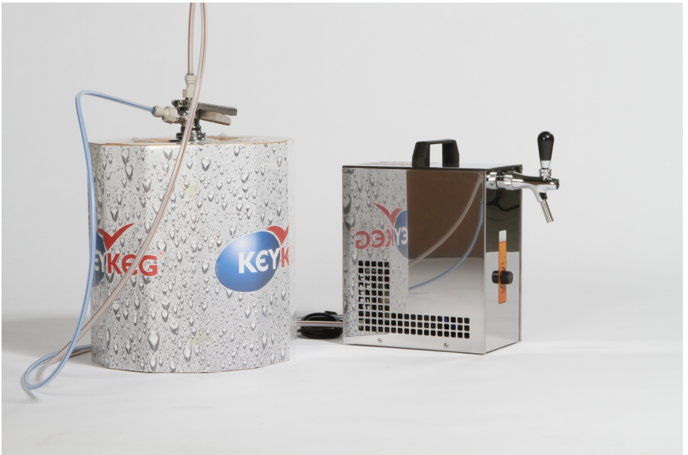
Фото: 2 DC30 подключён к КЕЙКЕГУ